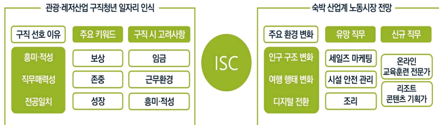
【그림4】 1분기·2분기 이슈리포트 주요 결과