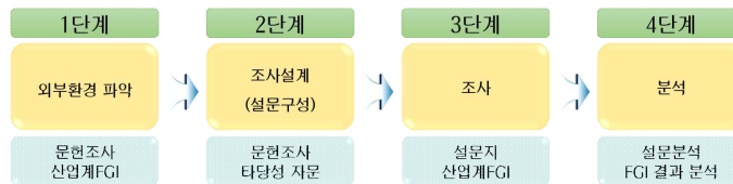
【그림3】 직무변화 분석 절차도